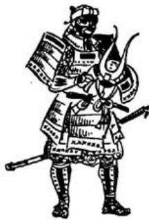
18. Мэмпо, кабуто