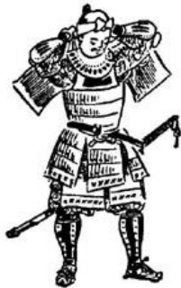
17. Нодова и хатимаки